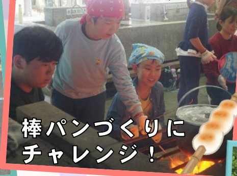
棒パンづくり チャレンジ!