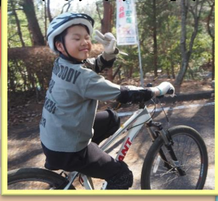
マウンテンバイク